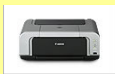
インクジェットプリンタ