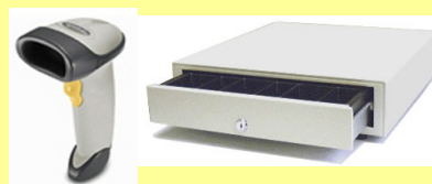
キャッシュドロワ(任意)

http://www.lightstaff.co.jp/content/opssy.html